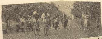
Jezdci vedoucí skupiny cestou.