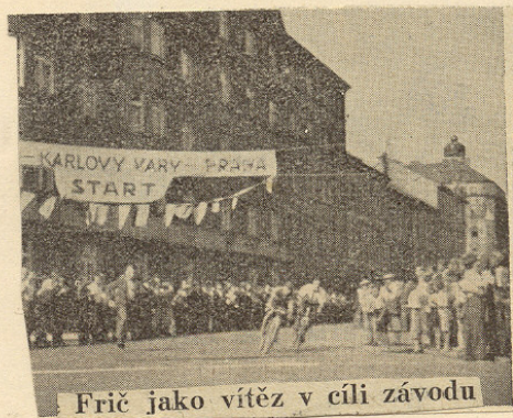
Frič jako vítěz v cíli závodu