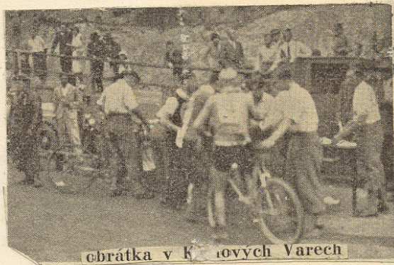
obrátká v Karlových Varech