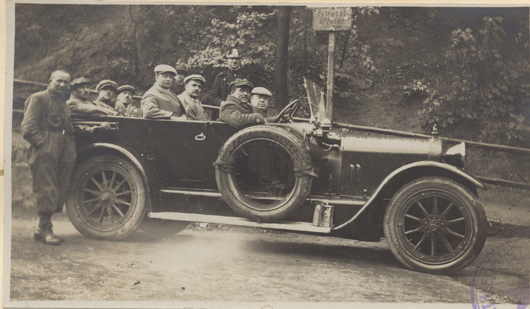
Na cestě z Kouř. Korů

„ Za nedlouho na to vydává se průvodní vůz páně Šubrtův i samitní auto na dalekou cestu. Ač jsme si cestu zkrátili, přece doháníme prvního závodníka na silnici za Dejvicemi. Při odbočce silnice na Jenerálku vidíme na postranní spojovací cestě v dálce dva zbloudilce, kteří sjeli z pravé cesty a nyní se vracejí. Ostatní závodníci díky mírnému tempu udrželi se všichni pohromadě a vidíme je na Dlouhé mýli v hustém houfci, který za nedlouho roztahuje se v malebný řetěz pestře dresovaných jezdců, v zelené aleji staletých stromů velmi pěkně se vyjímající. V tomže pořádku projíždějí závodníci i Stelčoves a teprve serpentiny za touto vesnicí, u Brandýsku a za Knovízí trhají tuto řadu. Několik jezdců má defekt kol nebo pneumatik a zůstává zpět, někteří junioři nevydrželi tempo vedoucí skupiny, kde přes tu chvíli někdo nasazuje na chvíli »trháka«, ale vida marnost úsilí, za krátko povoluje.