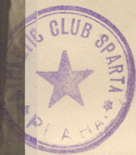
„Slovau Tiden“ účastnil se Karlovarského závodu