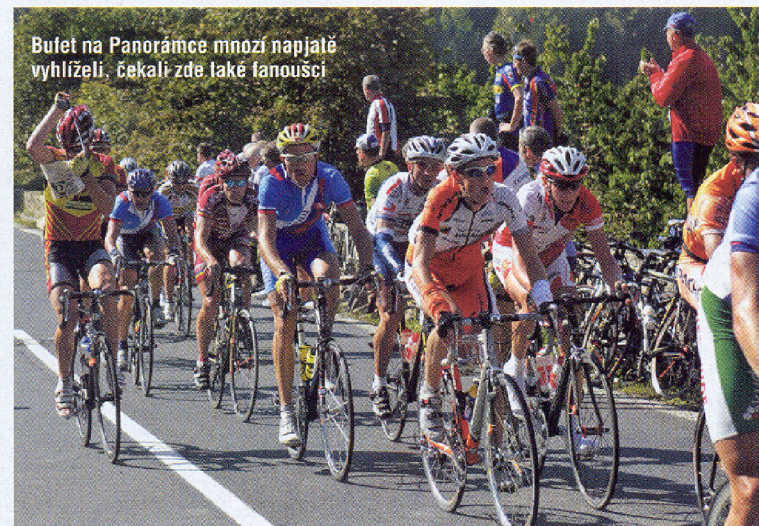
Buřet na Panorámce mnozí napjalě vyhlíželi, čekali zde také fanoušci